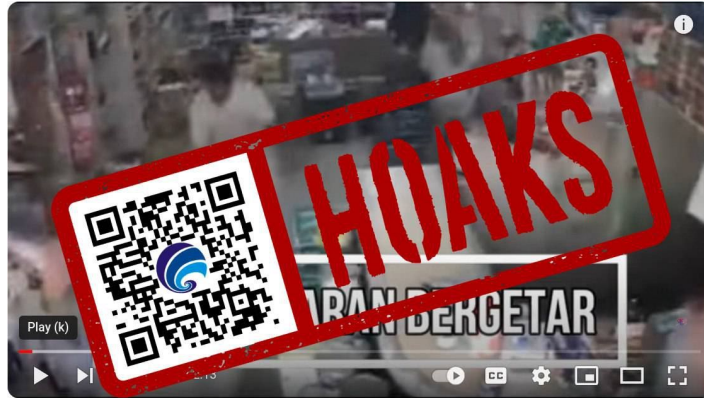
Pangandaran Hancur Lebur! Warga Berhamburan Gempa Melahap Pangandaran