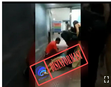
Woman Has Seizure After Taking Covid Vaccine In Argentina 604 x ditonton · 1 minggu yang lalu